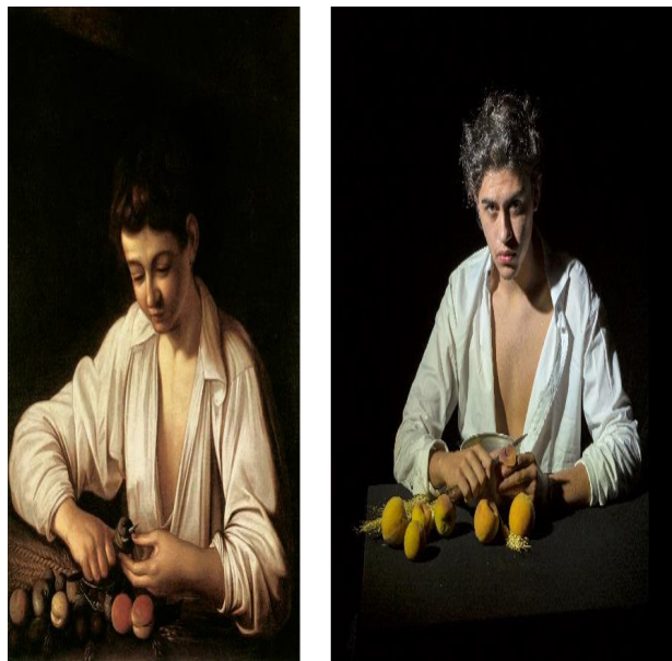
Figura 9. Resultado de la segunda sesión