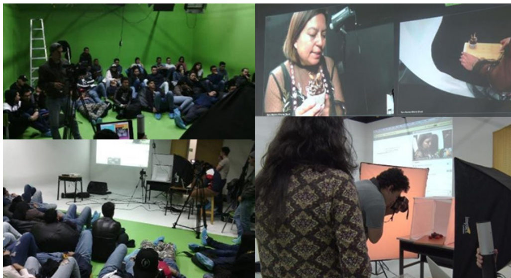
Figura 4. Orientación teórico-práctica de la primera sesión