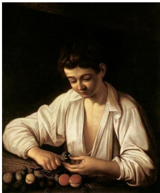
Figura 6. Muchacho pelando fruta