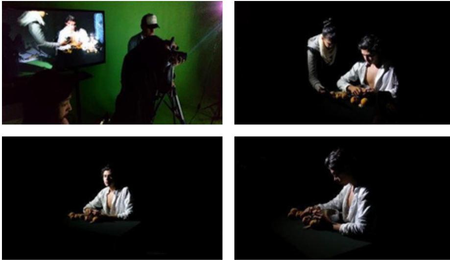
Figura 8. Proceso de creación práctica de la segunda sesión