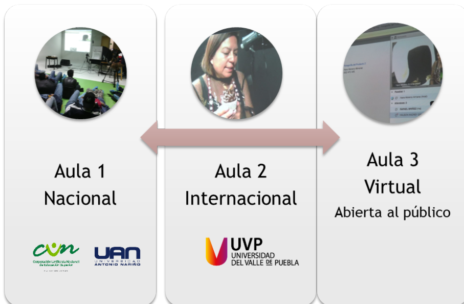
Figura 2. Estructura colaborativa en tres aulas

A partir del diseño estratégico, se estableció un modo de colaboración en tres escenarios académicos, interconectados por medio de las tecnologías proporcionadas por las instituciones participantes. La idea central de la creación de los escenarios buscó resolver el problema de la ejecución de ejercicios “teórico-prácticos” en tiempo real. Para ello, el primer espacio, denominado Aula 1 Nacional, consistió en el laboratorio especializado de fotografía adecuado con la misma tecnología y equipos del Aula 2 internacional (Figura 2). En el primer espacio, se hizo seguimiento, junto con docentes de contención, del ejercicio en vivo y de las instrucciones que impartía la profesora orientadora desde el segundo espacio. En un tercer escenario, Aula virtual 3, un grupo de estudiantes hacía seguimiento a la actividad junto con otro docente de contención, que les acompañó en la plataforma virtual.