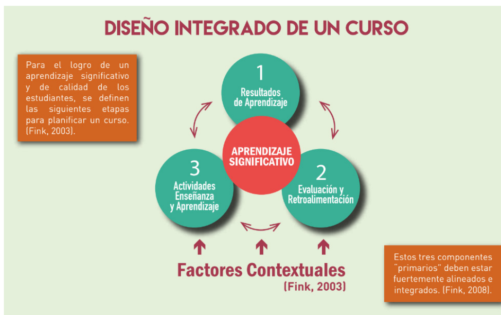
Gráfica 1. Diseño integrado de un curso