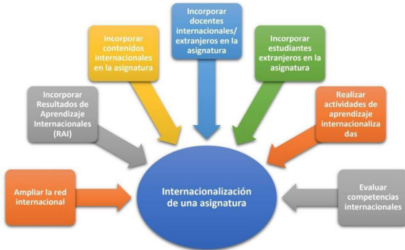
Figura 1. Estrategias para internacionalizar una asignatura